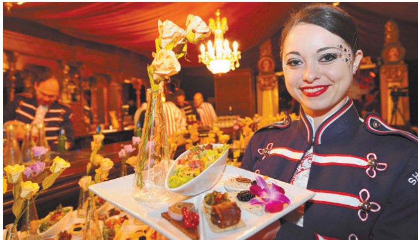
Bei «Clowns & Kalorien – das Original» kommen die Besucher in den Genuss eines exquisiten 4-Gang-Menüs.

Bei «Clowns & Kalorien – das Original» kommen die Besucher in den Genuss von Jongleuren, artistischen Darbietungen, Gesangseinlagen, Clowns und einem exquisiten 4-Gang-Menü, komponiert mit viel Liebe und Fantasie. Das Auge, der Gaumen und das Gemüt werden im originellen Verzehretheater mehr als