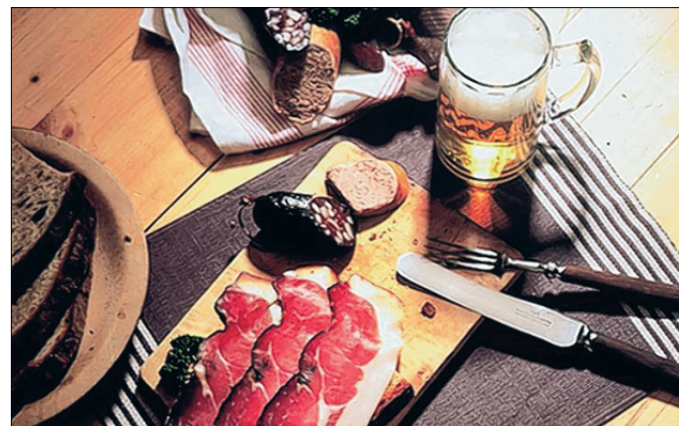
Warum in die Ferne schweifen, denn das Gute liegt so nah: Die Schwarzwälder Vesperplatte ist nur eine von vielen regionalen Spezialitäten in Baden-Württemberg.

Erzeugnisse bei, die nicht der Massenproduktion, sondern bis heute traditioneller Landwirtschaft entstammen. Zum kulinarischen Genuss gehören auch Weine. Veranstaltungen, wie das europäische Wein-Gipfeltreffen artvinum, die Vergabe des Witzigmann-Preises oder die deutsche Slow-Food-Messe in Stuttgart stellen sie vor.